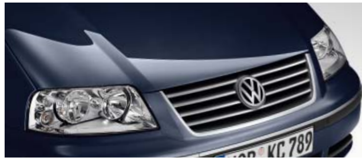
Perlblau Uni-Lackierung D3