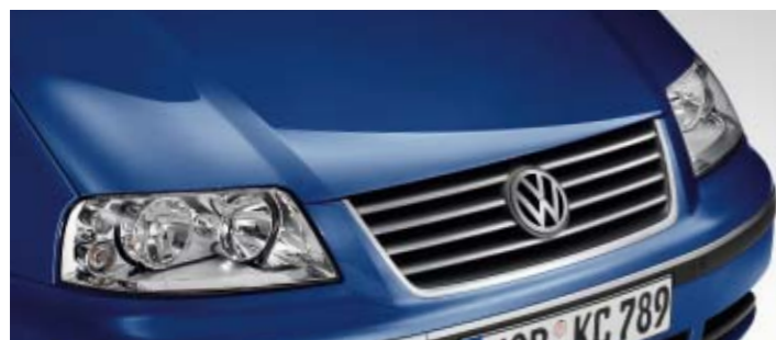
Shadow Blue Metallic-Lackierung P6