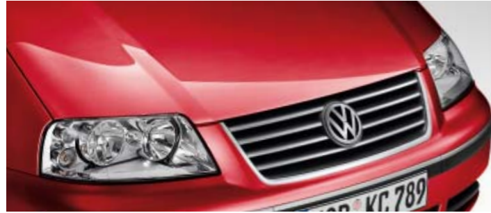
Salsa Red Uni-Lackierung 4Y

Die Entscheidung, welche Farbe am besten zu Ihnen passt, können wir Ihnen natürlich nicht abnehmen. Die Vielfalt macht die Auswahl vielleicht schwer, aber sie ermöglicht es Ihnen auch, Individualität zum Ausdruck zu bringen. Doch egal wofür Sie sich entscheiden, Brillanz in der Farbe, beste Materialqualität und hervorragende Verarbeitung wählen Sie in jedem Fall.