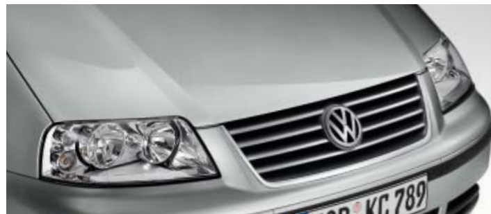
Reflexsilber Metallic-Lackierung 8E