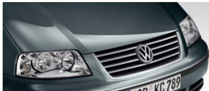
Berylliumgrau Metallic-Lackierung M8