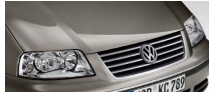
Slate Grey Metallic-Lackierung X9