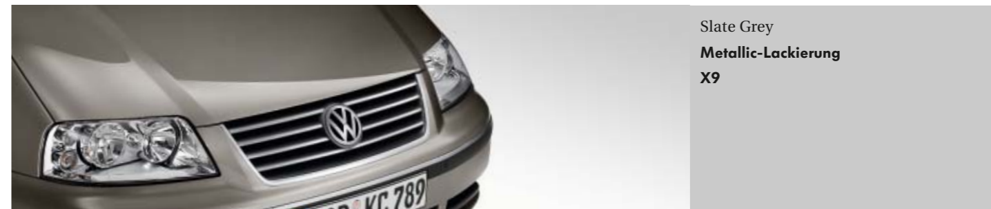
Slate Grey Metallic-Lackierung X9