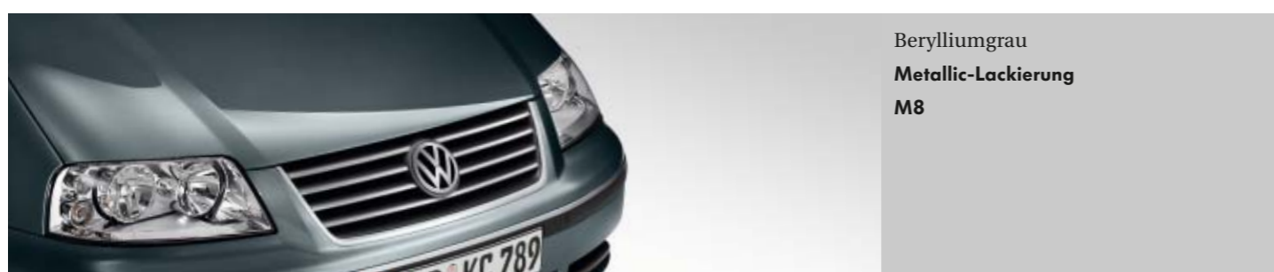
Berylliumgrau Metallic-Lackierung M8