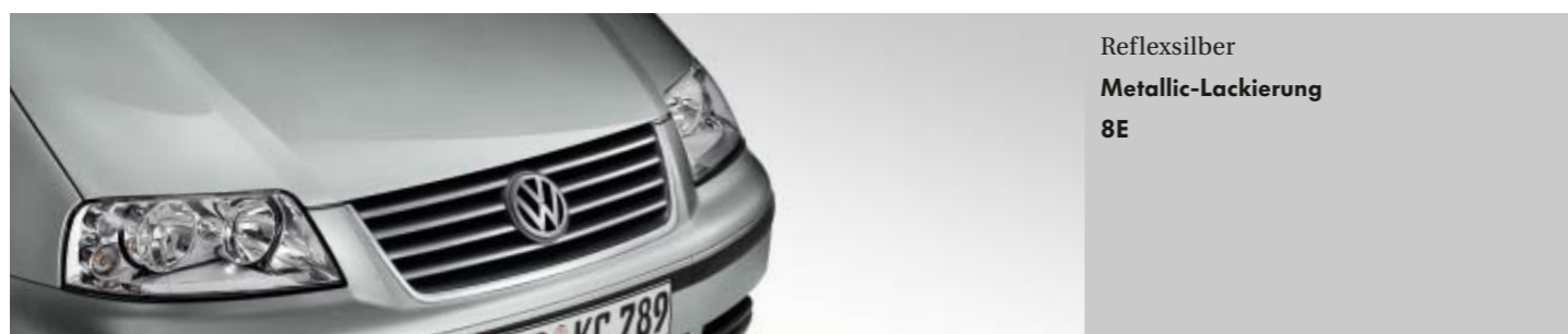
Reflexsilber Metallic-Lackierung 8E