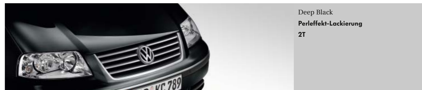
Deep Black Perleffekt-Lackierung 2T