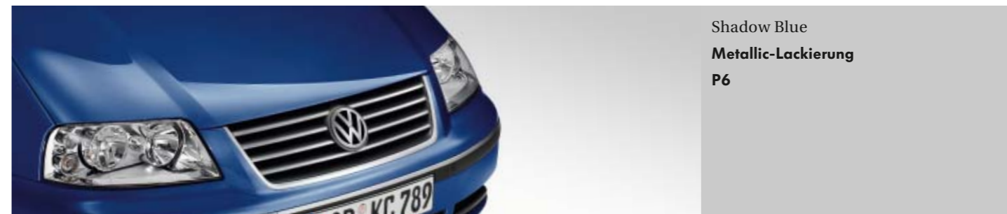
Shadow Blue Metallic-Lackierung P6