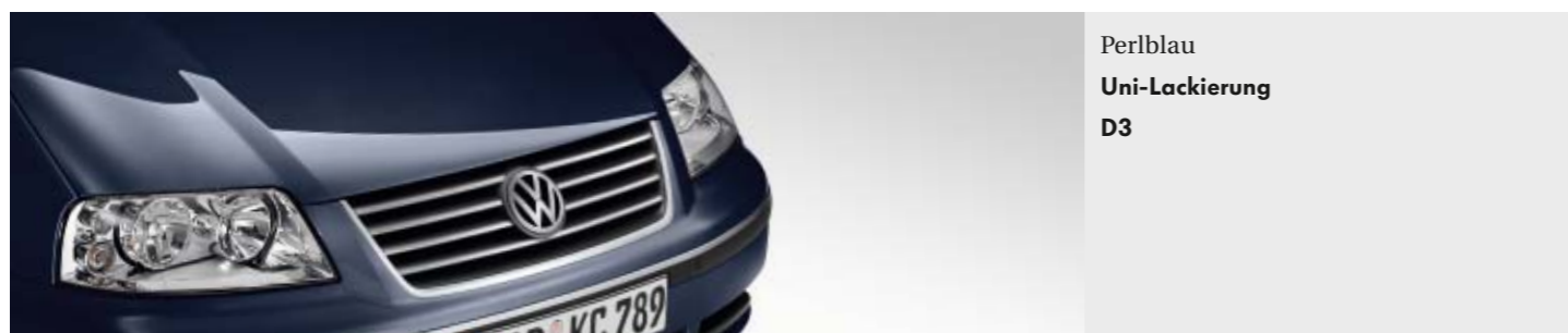
Perlblau Uni-Lackierung D3