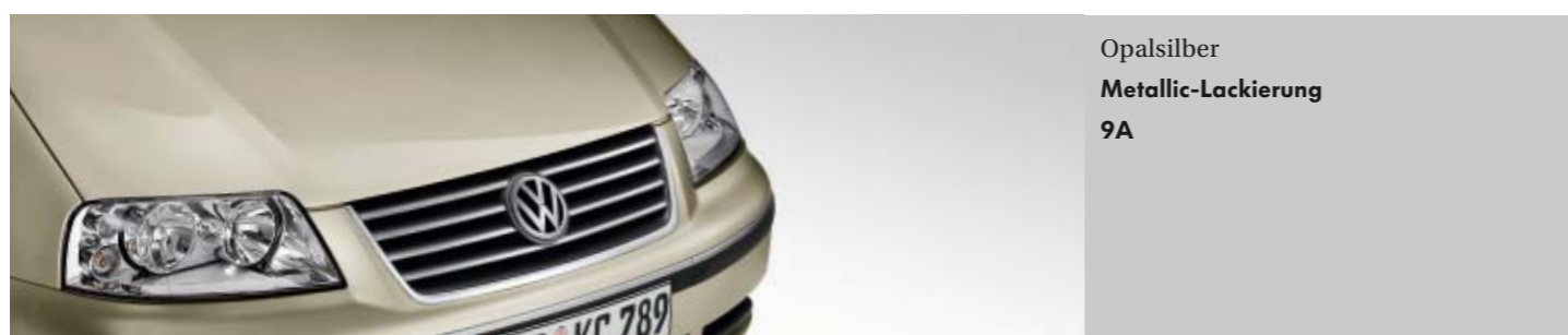
Opalsilber Metallic-Lackierung 9A