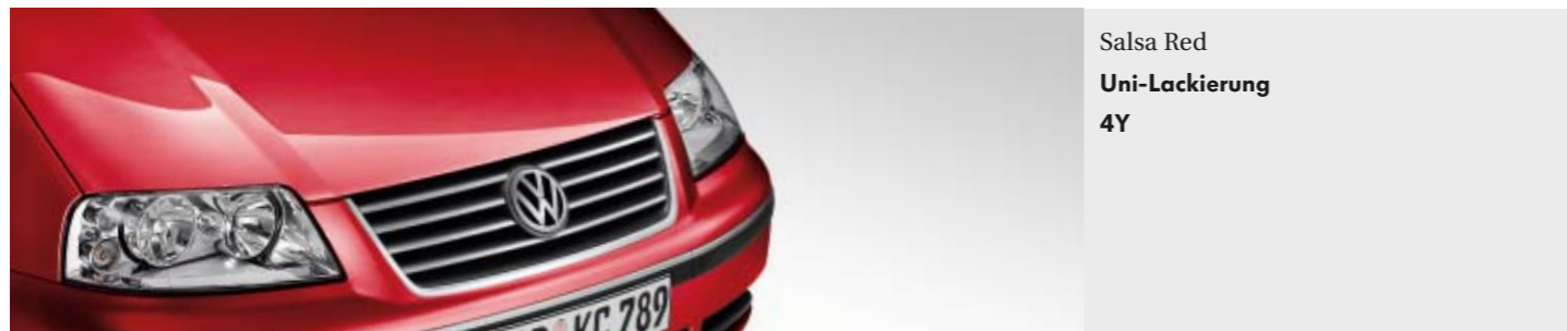
Salsa Red Uni-Lackierung 4Y

Die Entscheidung, welche Farbe am besten zu Ihnen passt, können wir Ihnen natürlich nicht abnehmen. Die Vielfalt macht die Auswahl vielleicht schwer, aber sie ermöglicht es Ihnen auch, Individualität zum Ausdruck zu bringen. Doch egal wofür Sie sich entscheiden, Brillanz in der Farbe, beste Materialqualität und hervorragende Verarbeitung wählen Sie in jedem Fall.