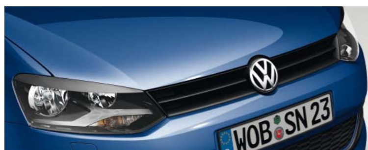
Meerblau Uni-Lackierung F4