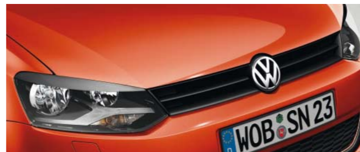
Hot Orange Metallic Metallic-Lackierung 4S