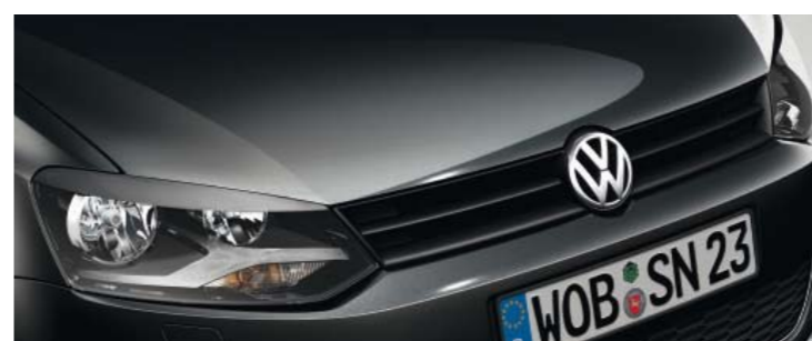
Deep Black Perleffekt-Lackierung 2T