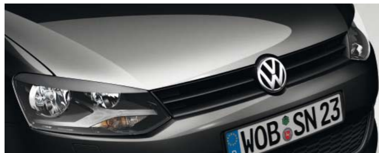
Schwarz Uni-Lackierung A1

Das aufwendige Lackierungsverfahren von Volkswagen wird allerhöchsten Ansprüchen gerecht. Die Basis für einen perfekten Lackauftrag bildet die galvanische Verzinkung als zuverlässiger Korrosionsschutz. Dieser bewahrt Ihr Fahrzeug über dessen gesamte Lebensdauer bestmöglich vor Oxidation – und das bei einer Dicke von weniger als 20 Millionstel Millimetern.