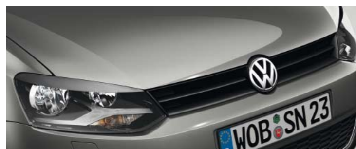
Pepper Grey Metallic-Lackierung U5