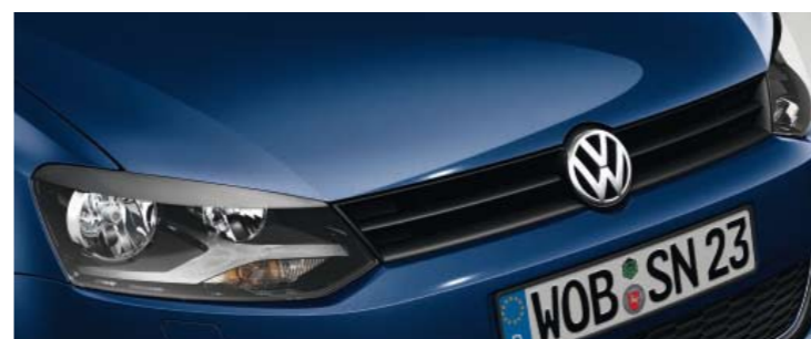
Shadow Blue Metallic-Lackierung P6