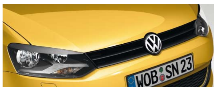
Savanna-Gelb Uni-Lackierung H5