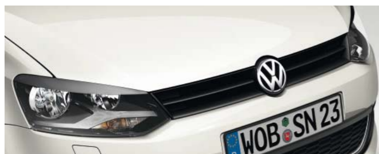
Candy-Weiß Uni-Lackierung B4