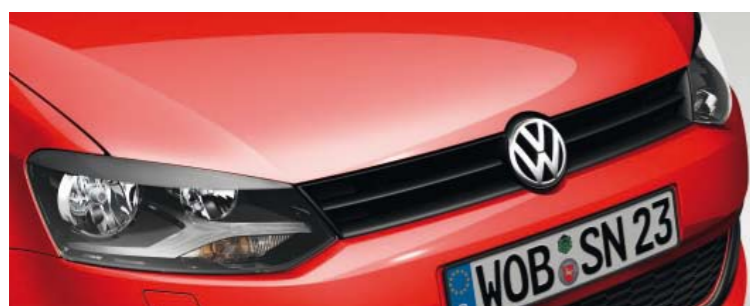
Flash-Rot Uni-Lackierung D8