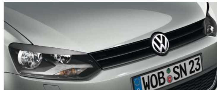
Reflexsilber Metallic-Lackierung 8E