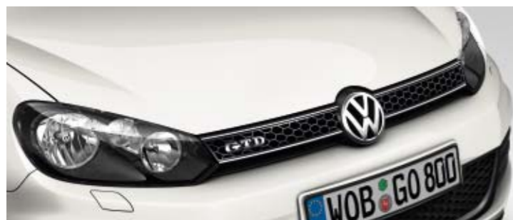
Candy-Weiß Uni-Lackierung B4