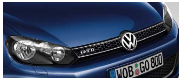
Shadow Blue Metallic-Lackierung P6