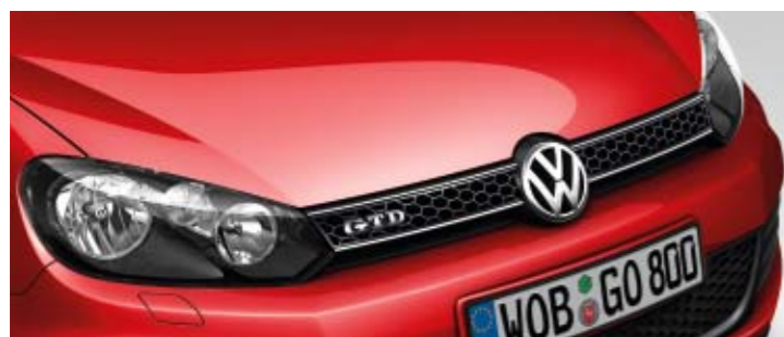
Tornadorot Uni-Lackierung G2