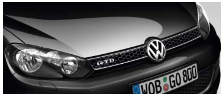
Schwarz Uni-Lackierung A1

Die Entscheidung, welche Farbe am besten zu Ihnen passt, können wir Ihnen natürlich nicht abnehmen. Die Vielfalt macht die Auswahl vielleicht schwer, aber sie ermöglicht es Ihnen auch, Individualität zum Ausdruck zu bringen. Doch egal, für welche Lackierung oder für welchen Sitzbezug Sie sich entscheiden, Brillanz in der Farbe, beste Materialqualität und hervorragende Verarbeitung wählen Sie in jedem Fall.