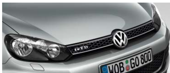
Reflexsilber Metallic-Lackierung 8E