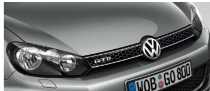
United Grey Metallic-Lackierung X6