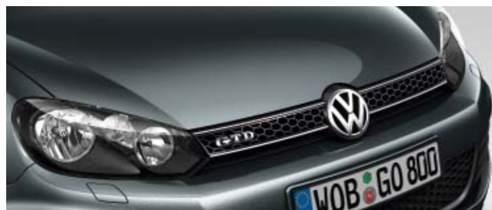
Carbon Steel Grey Metallic-Lackierung 1K