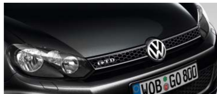
Deep Black Perleffekt-Lackierung 2T